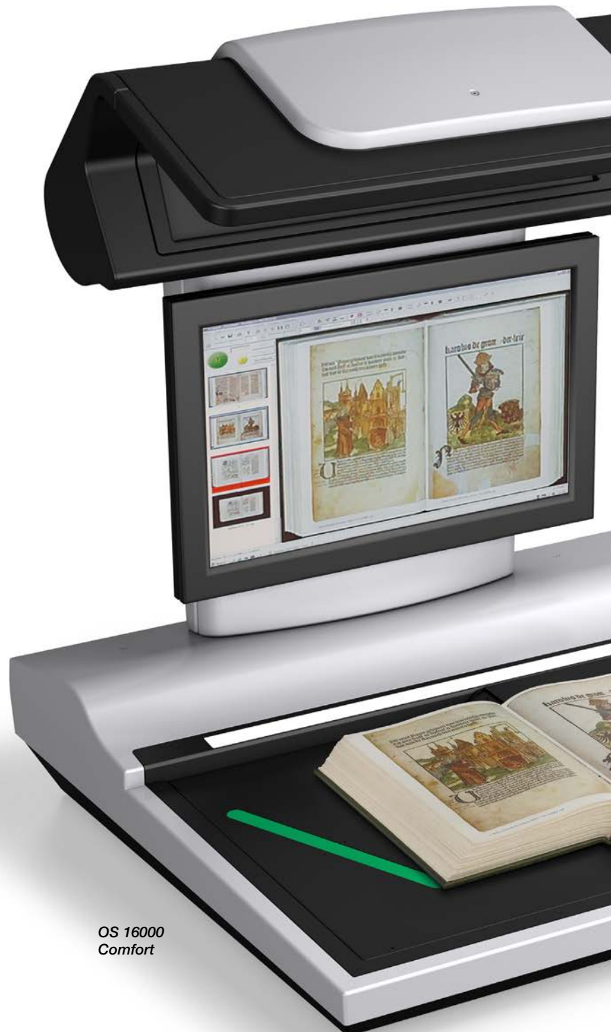
OS 16000 Comfort

Die OS 16000 Buchscanner entsprechen den Anforderungen unserer Anwender. Es sind leistungsstarke Produktionsscanner, die sanft zum Buch und dabei sehr komfortabel im Handling sind. Die homogene, schattenfreie Ausleuchtung und die überlegene Scantechnik sorgen für Images in exzellenter Qualität. Die Absenkautomatik und der Autostart garantieren hohen Durchsatz.