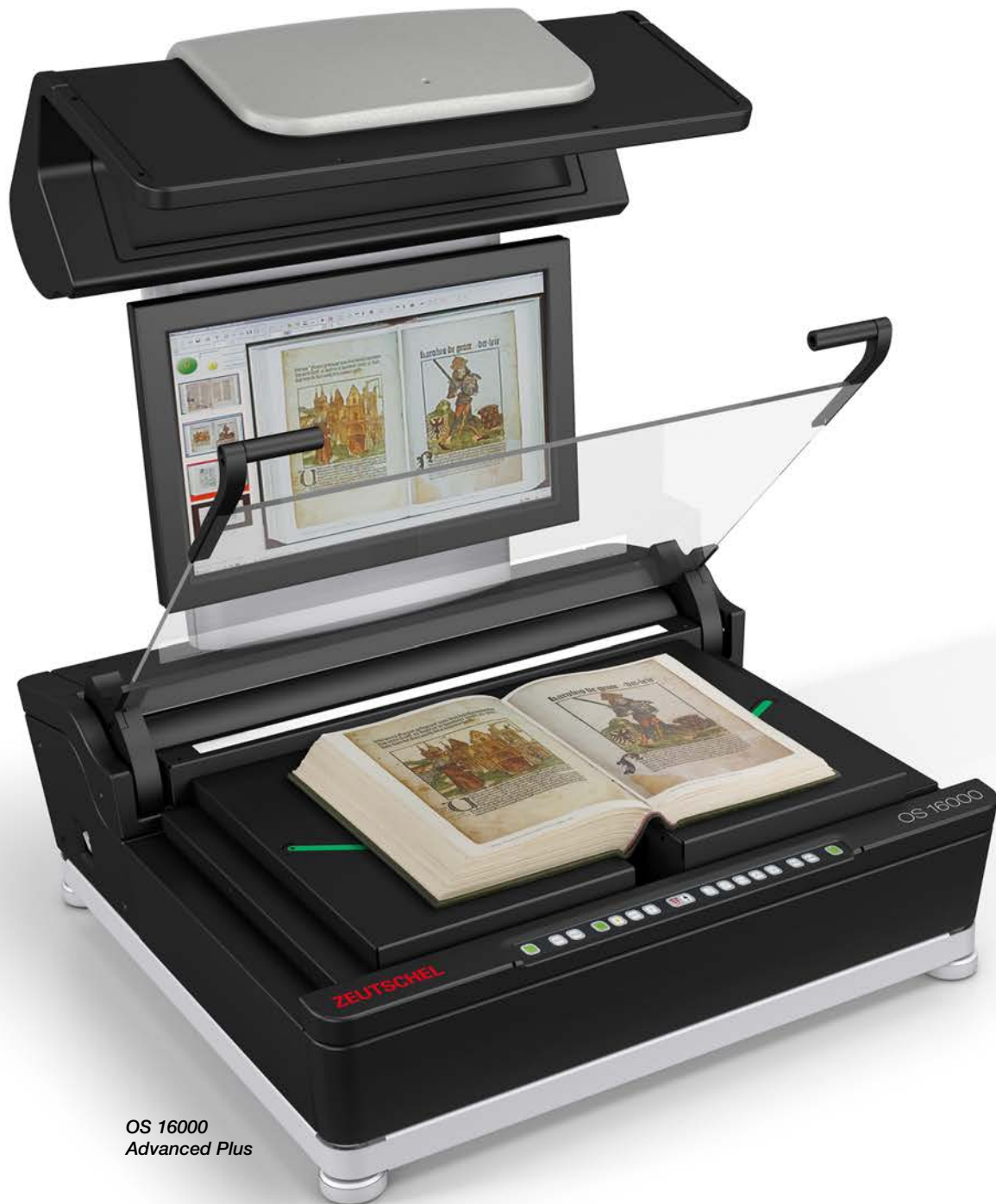
OS 16000 Advanced Plus